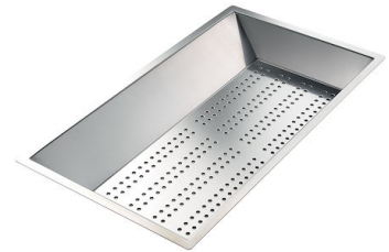
CUVETTE INOX PERFOREE A151 F00 * uniquement en combinaison avec l'accessoire A644 A01