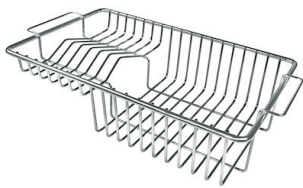
GRILLE PORTE-ASSIETTES INOX 250x425 A100 B01