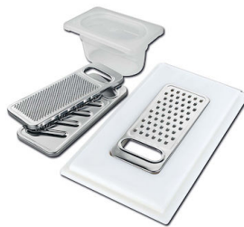
KIT RÂPES ET PLANCHE DE DECOUPE HDPE A159 A01 * uniquement en combinaison avec l'accessoire A644 A01