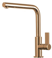
VERONA COPPER R497 D06